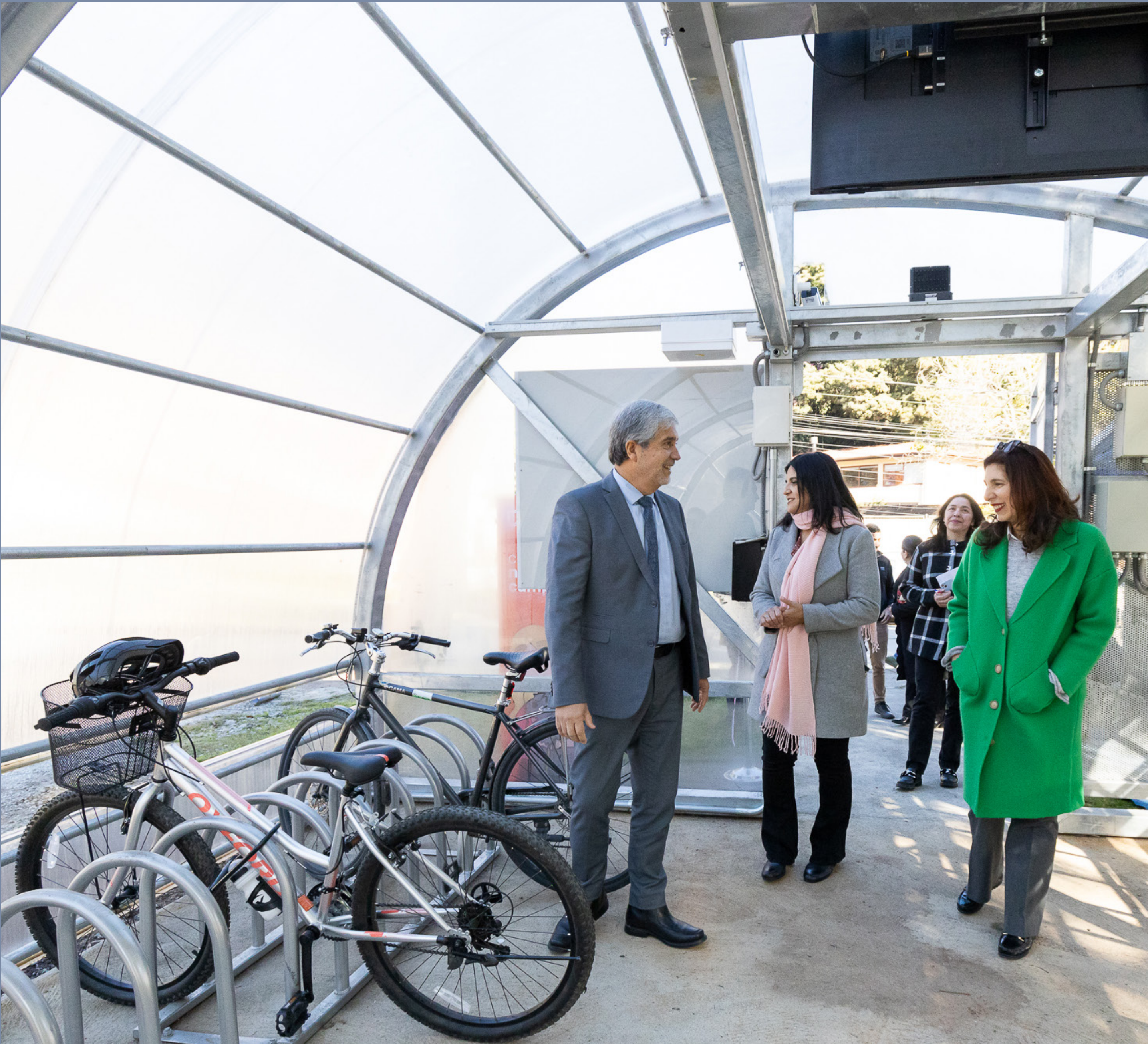
► Fotografía: Inauguración bicicleteros Campus Concepción