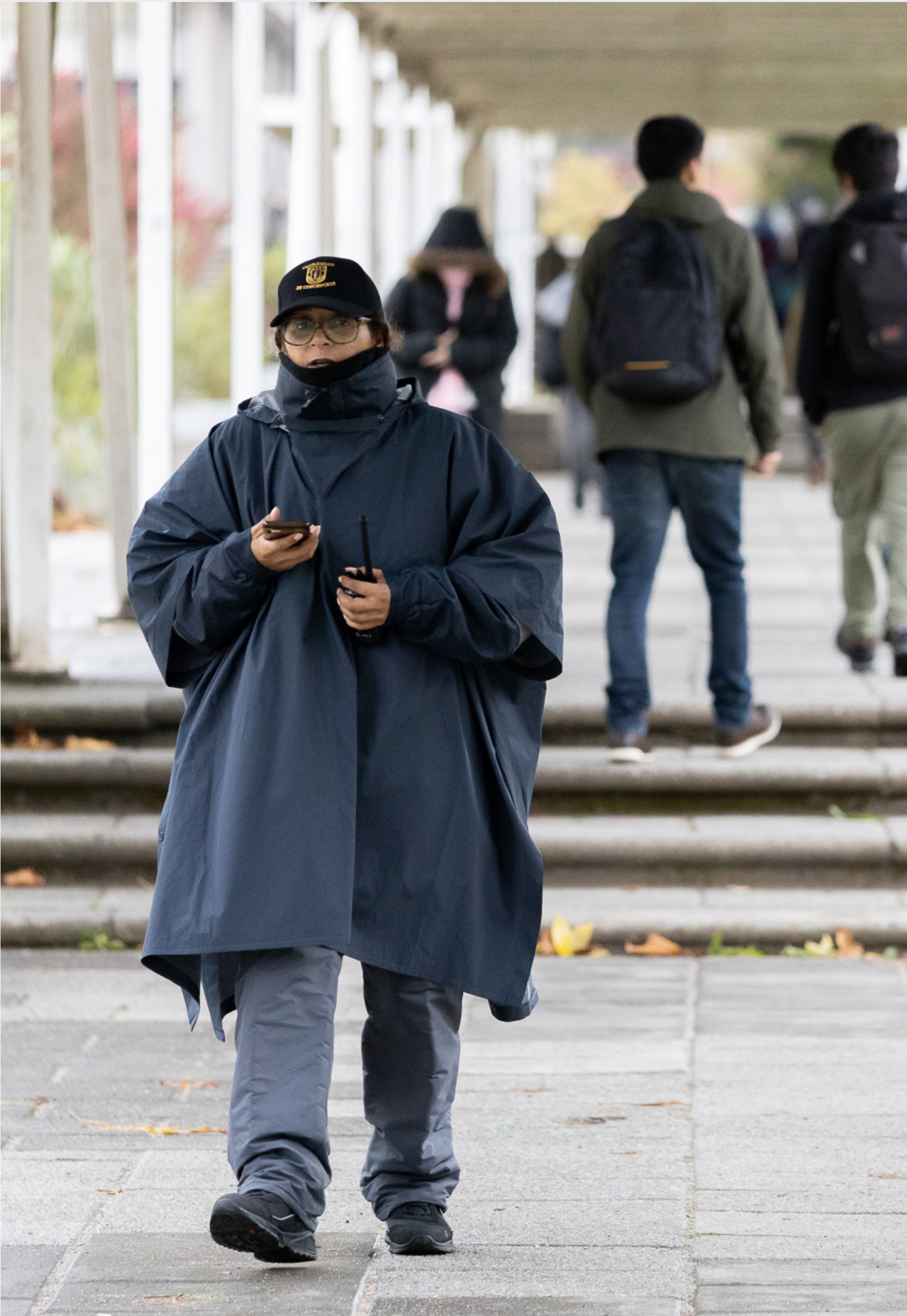
► Fotografía: Seguridad en UdeC

Con ello, la Universidad supera los 900 espacios para estacionar bicicletas, por encima del 3% comprometido en el II Acuerdo de Producción Limpia Educación Superior Sustentable, iniciativa de la Red de Campus Sustentable y la Agencia de Sustentabilidad y Cambio Climático.