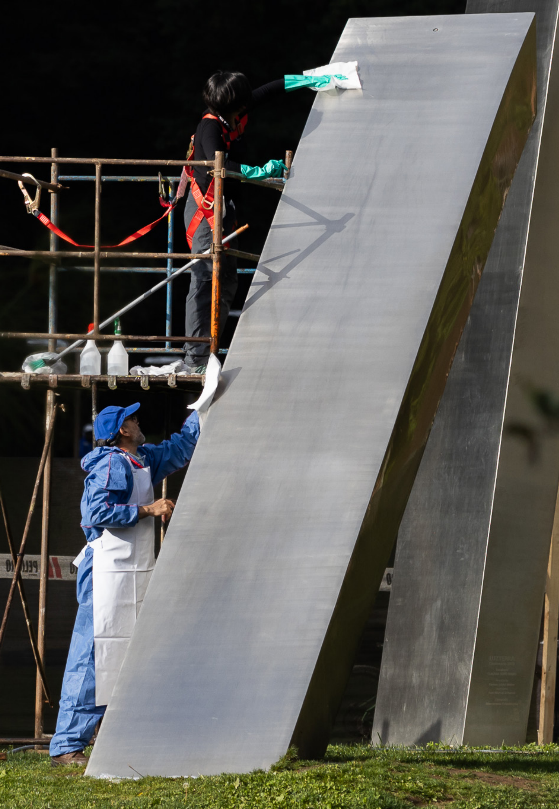
► Fotografía: Limpieza Luz Terra.